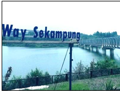
Gambar 1. Bendungan Way Sekampung