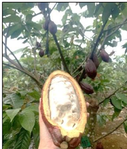
Gambar 3. Kebun Cokelat

Kesiapan Desa Wisata Lugusari dalam menerima kunjungan didukung dengan pembenahan sarana dan prasarana serta daya tarik wisata yang disediakan oleh Pekon dan masyarakat, seperti tersedianya homestay yang hingga pertengahan tahun 2023 tercatat sudah ada 25 homestay di kawasan Pekon. Reservasi homestay dikoordinasikan dengan melihat