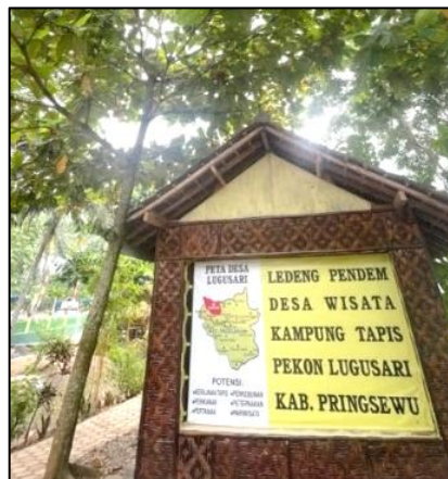
Gambar 2. Ledeng Pedem